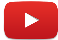
Chaine La Fabrique du Changement

Le podcast des professionnels qui veulent transformer leurs organisations.