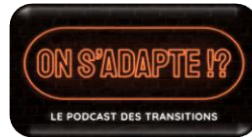
Podcast "On s'adapte!?"

Son objectif : vous faire du bien Inscription sur notre site web